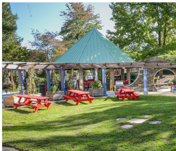
Jardim de Cura Balise