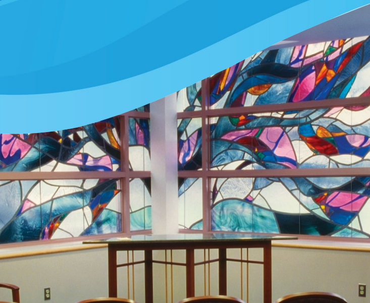
Hasbro Children's Chapel