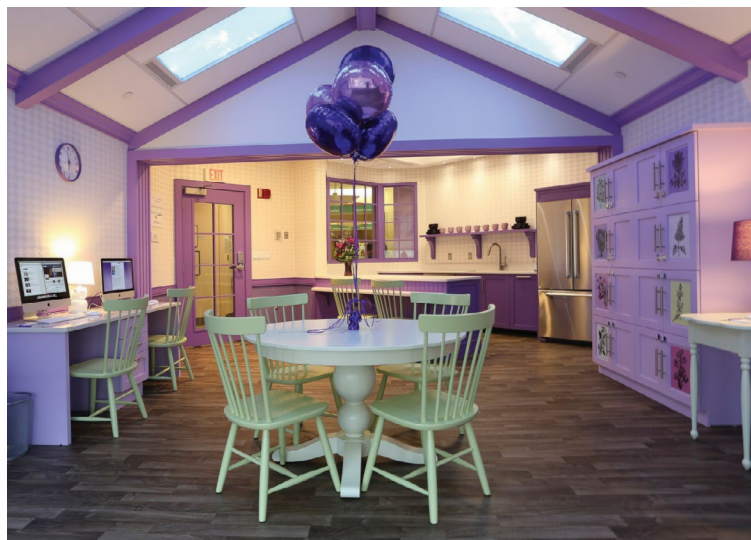
La sala familiar Izzy

La sala familiar Izzy está ubicada en el 5.º piso. Se trata de un espacio familiar tanto para los padres/cuidadores como para los pacientes. La Fundación Izzy ofrece refrigerios, café, artículos de higiene y comidas la mayoría de los días. Está equipada con una cocina, microondas, computadoras, televisión y cómodos asientos. Para su comodidad, el espacio está abierto las 24 horas del día. Solicite el código de acceso a la secretaria de la unidad.